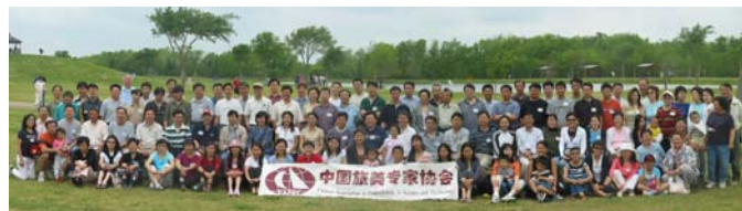
（2005 年春季野餐合影。此照片可以从专协网站下载）

理事和顾问们深深的体会到这次的春季野餐会不仅增加了专协会员和总领馆的朋友们之间彼此的友谊和了解，而且通过这次活动让每一位参加者感受到专协是一个温暖、充满活力和爱的大家庭。最后，参与野餐会的全体人员合影留念，记下这难忘的一天。（洪澄 供稿）